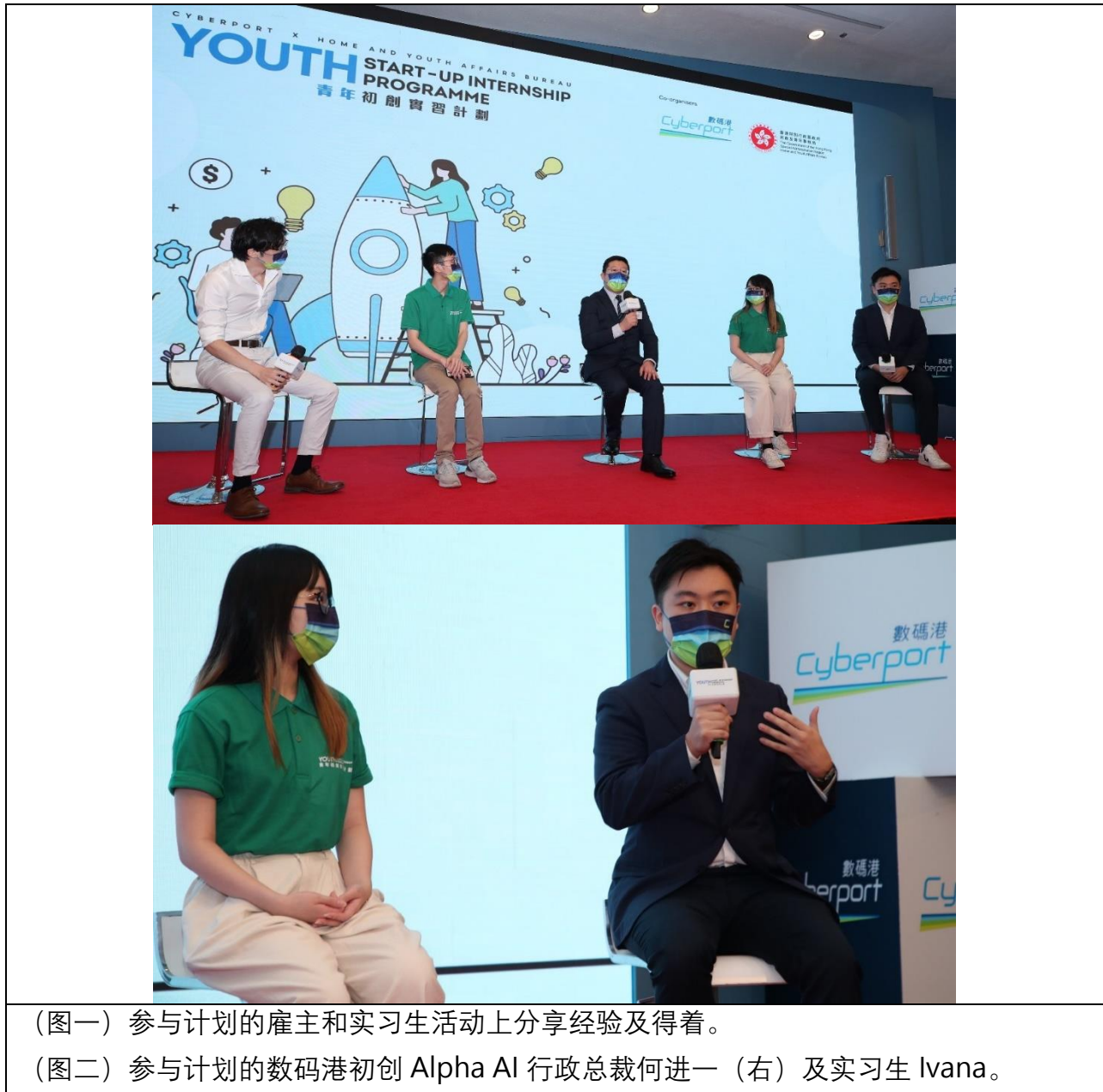
(图一) 参与计划的雇主和实习生活动上分享经验及得着。