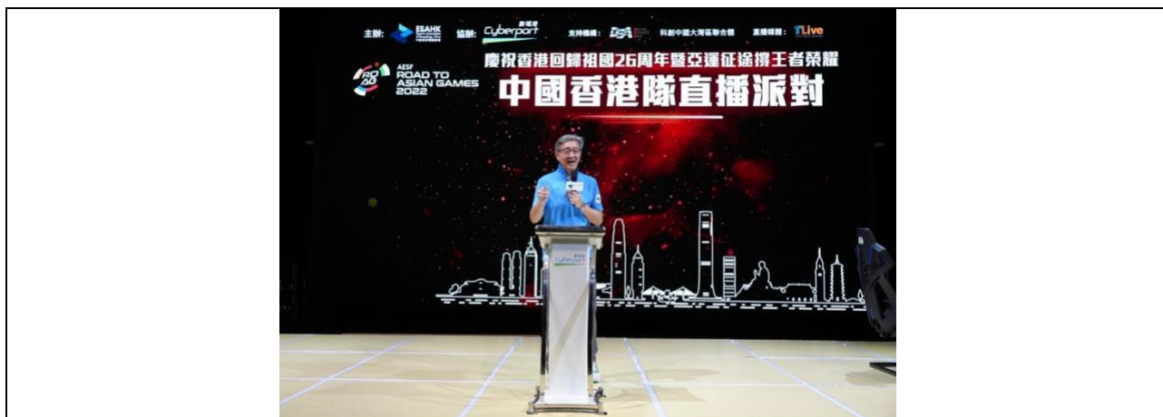
数码港行政总裁任景信为活动致辞。