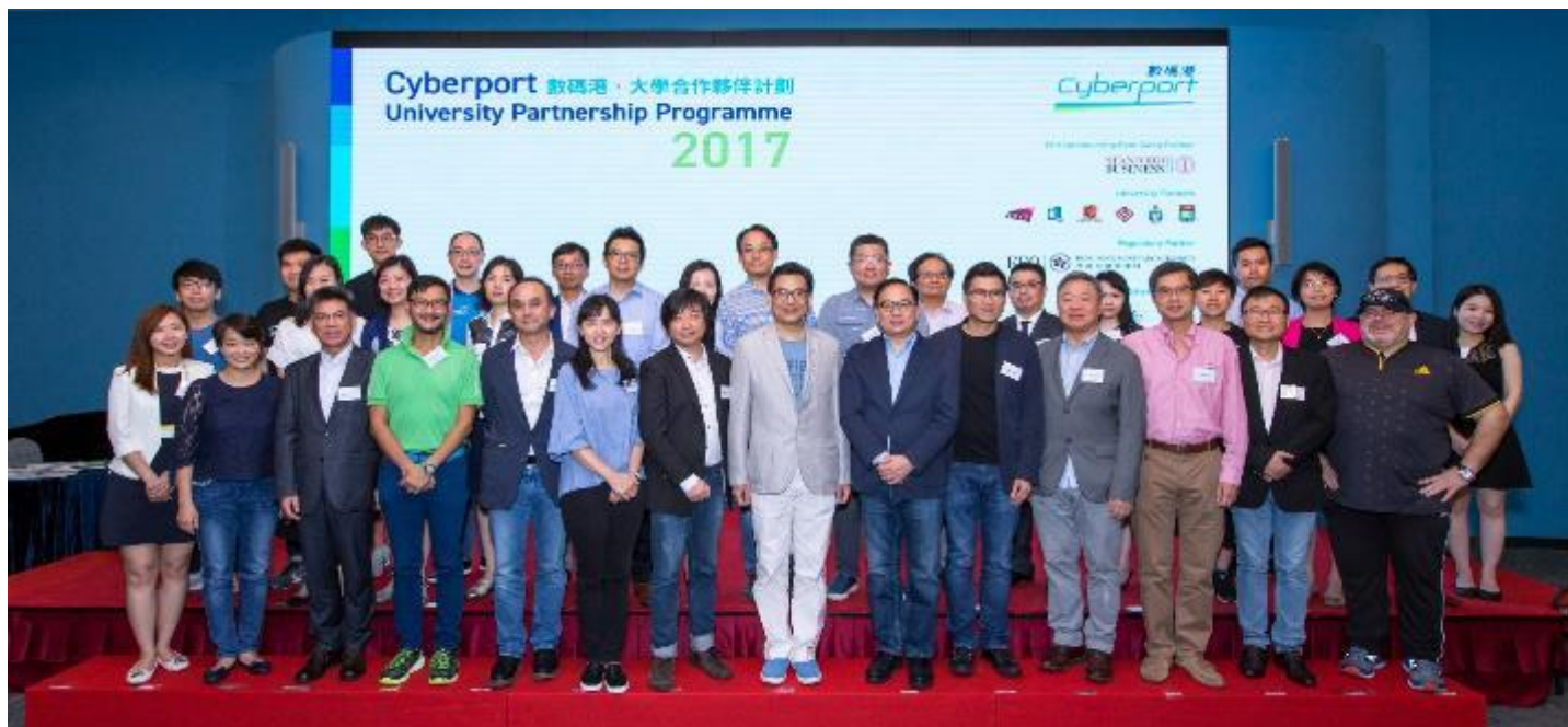
[圖二] 「數碼港•大學合作夥伴計劃 2017」於上周六(7月22日)日正式啓動。主禮嘉賓政府資訊科技總監楊德斌先生、數碼港一眾管理層及計劃夥伴代表親臨到場為同學打氣。