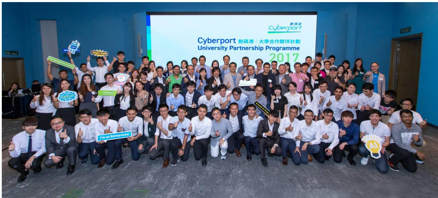
[圖四]「數碼港·大學合作夥伴計劃 2017」共有 21 支來自六間本地大學的代表隊伍參與，他們將參與一連串創業培訓，與業界菁英交流學習，並於九月下旬赴美參與度身訂造的創業營，學習金融科技創業之道。